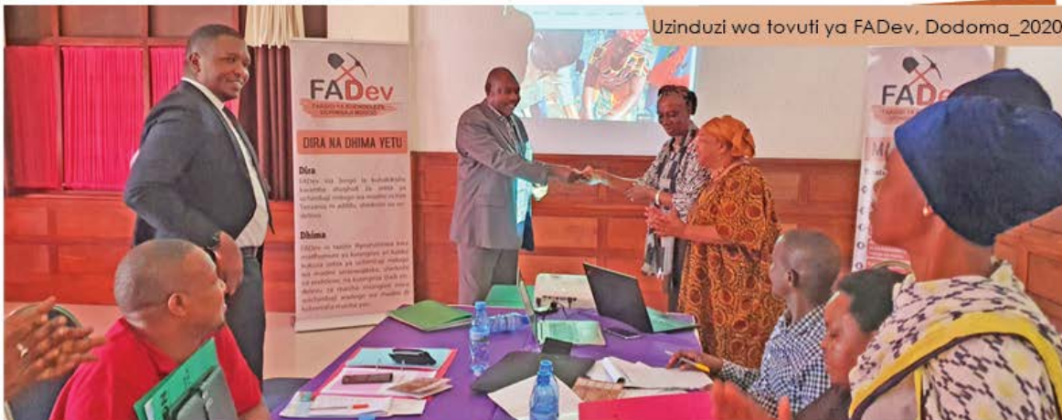
Uzinduzi wa tovuti ya FADev, Dodoma_2020