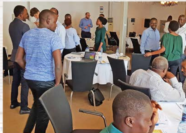
Kikao cha wadau wa Sekta, Dar es Salaam_2018