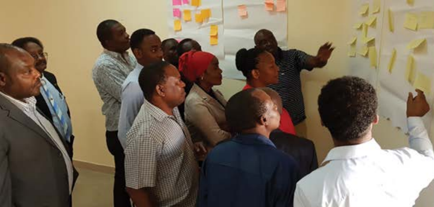
Kikao cha kimkakati Dodoma_2018