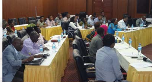
Mdahalo ya Wadau wa Sekta Mwanza_2018