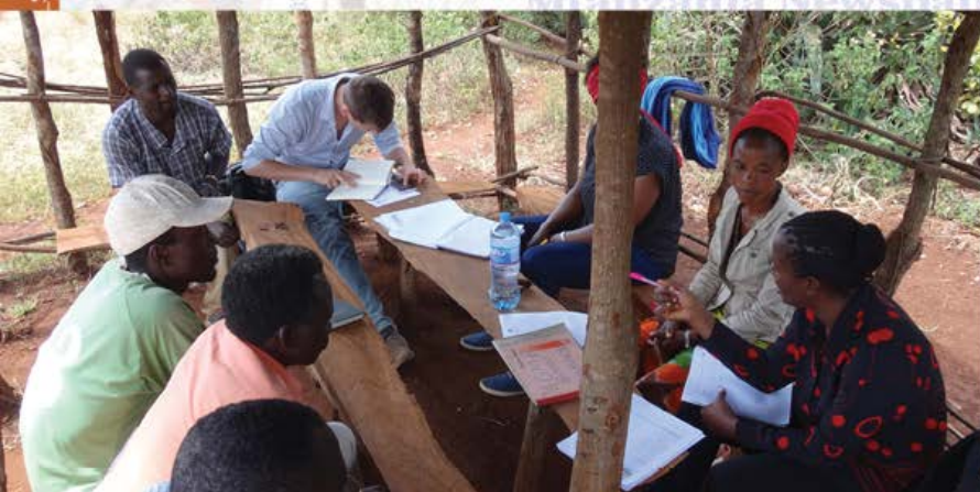
Ukusanyaji taarifa za awali, Ibondo_2019