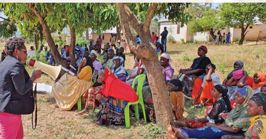
Elimu ya kujikinga dhidi ya Uviko-19, Nyarugusu_2020