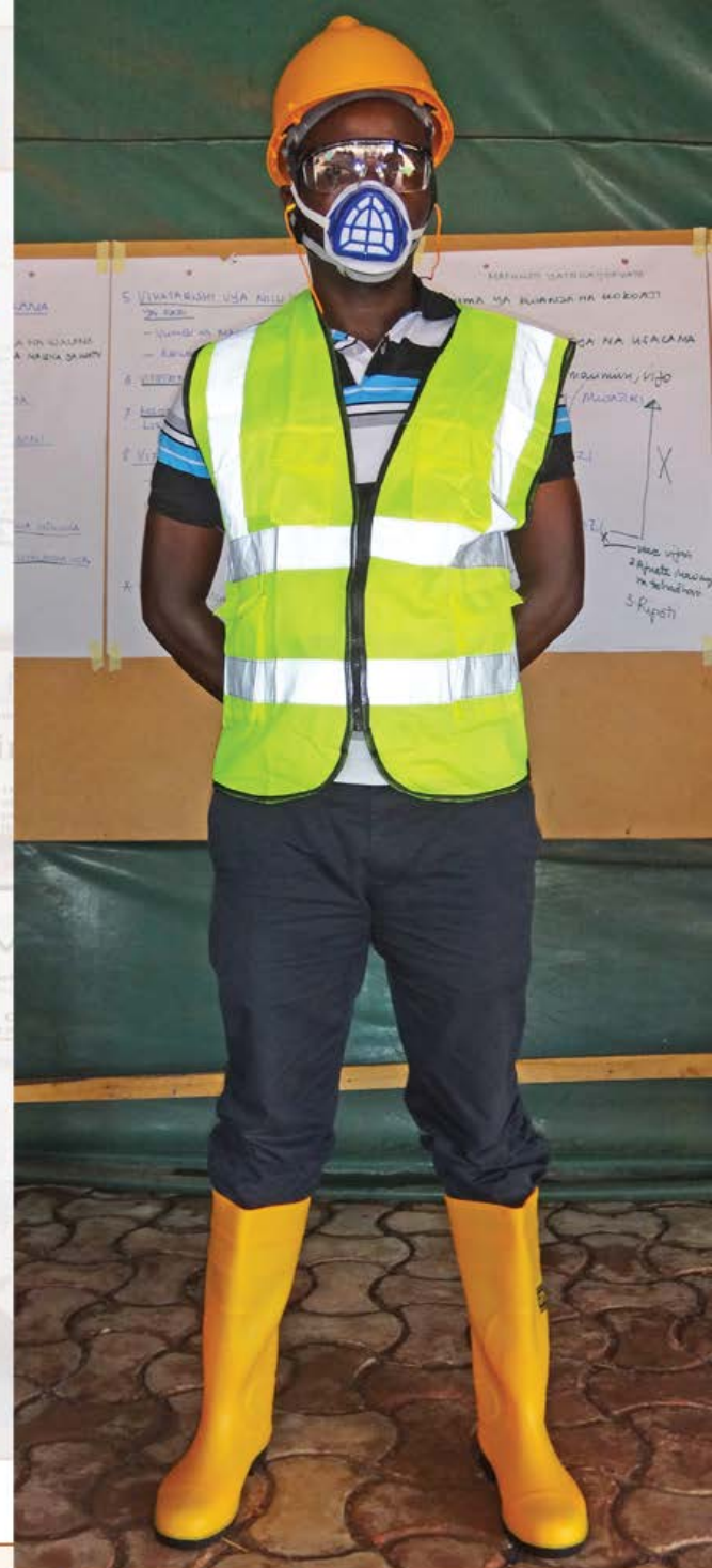
Elimu ya Usalama_2020