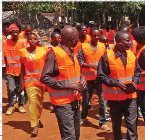
Ziara ya Mafunzo, Nsangano_2019