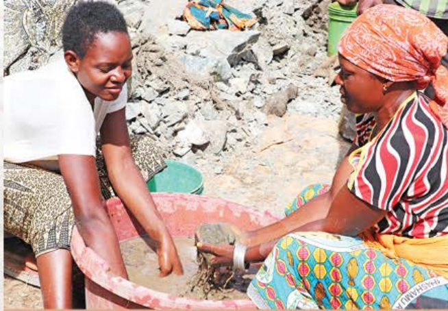
Wanawake wachimbaji wadogo, Nyakagwe_2019