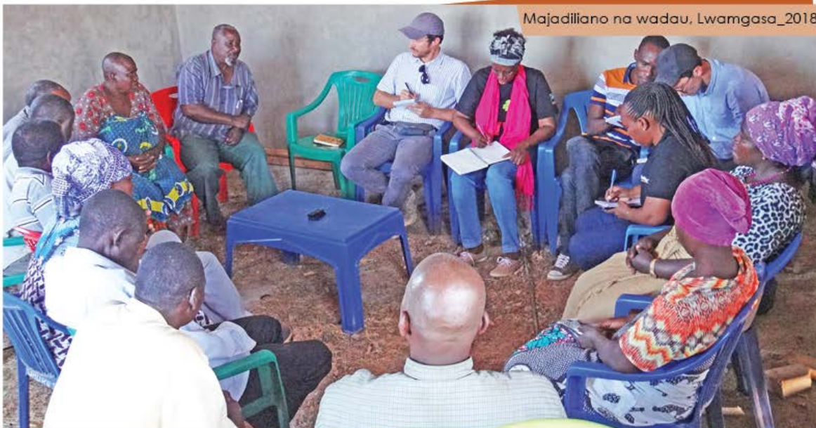
Majadiliano na wadau, Lwamgasa_2018